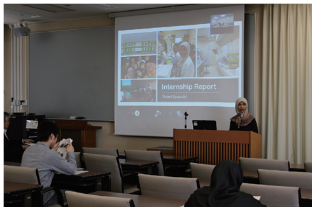
研究インターンシップ報告会 Research internship presentation