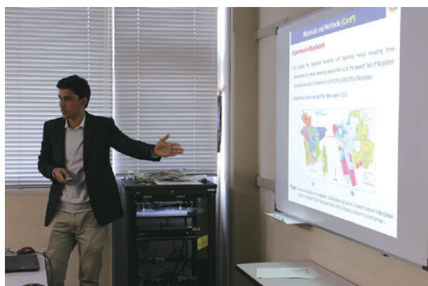
研究発表するサンドイッチプログラムの学生 Research Presentation by Sandwich program student

“Non-degree” status (UGSAS-GU Special Research Student)