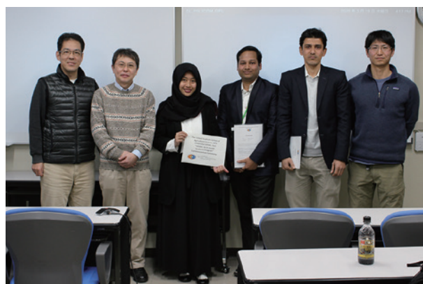
修了証授与 Award of the certificate