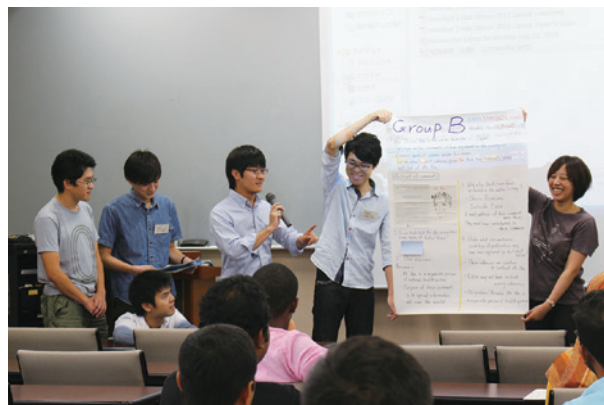
研究者倫理・職業倫理・メンタルヘルス・フィジカルヘルス Researcher Ethics, Professional Ethics, Mental Health, Physical Health