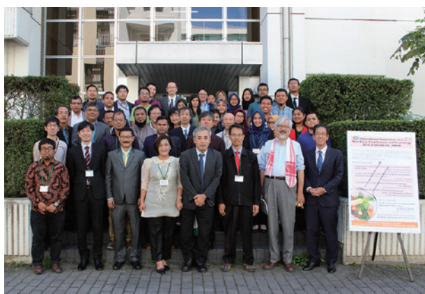
岐阜大学での国際シンポジウム（10月） International Symposium in Gifu University (October)

The United Graduate School of Agricultural Science was formed, with the Graduate School of Integrated Science and Technology, Shizuoka University and the Graduate School of Applied Biological Sciences, Gifu University as its primary foundation, to establish a unique and flexible educational research organization by synergistically linking the constituent universities and to realize education through which a broad perspective, highly professional knowledge and technology, comprehension skills, deep insight and power of execution will be acquired. Through cultivating researchers and professional engineers/technologists with highly professional competence, abundant academic knowledge and a broad perspective, it also aims to contribute to the advancement of agricultural science and the development of biological-resources-related industries.