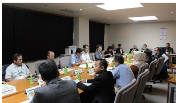
岐阜でのラウンドテーブル2019(10月) Roundtable 2019 in Gifu (October)

※The United Graduate School of Agricultural Science was reestablished in AY2010 into the present organization consisting of Gifu University and Shizuoka University.