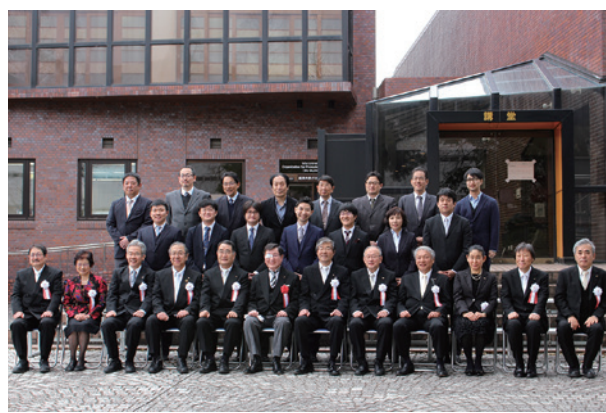
学位記授与式 (3月) Commencement (March)