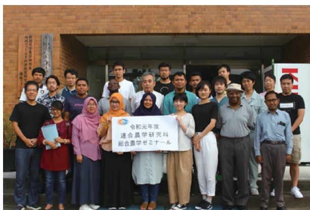
総合農学ゼミナール Integrated Agricultural Seminar

We adopt a high and rigid standard of authorizing the doctoral degree in order to guarantee that our qualified students have acquired or achieved the high level of these five abilities.