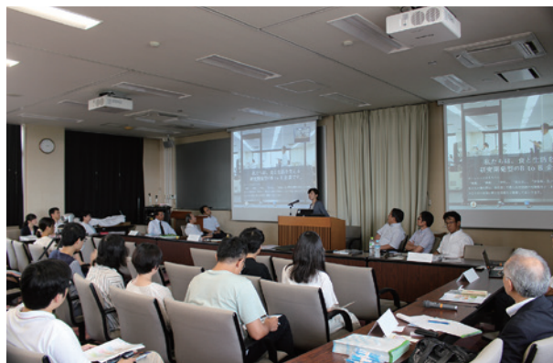
岐阜大学でのインダストリー部会学生懇談会(7月) Industry Subcommittee roundtable in Gifu University (July)