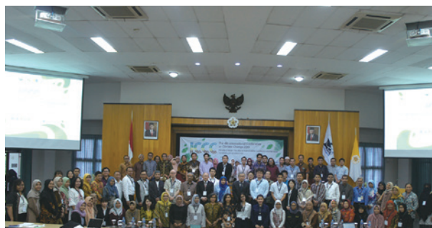
ガジャマダ大学での国際会議(11月) International Conference in University of Gadjah Mada (November)